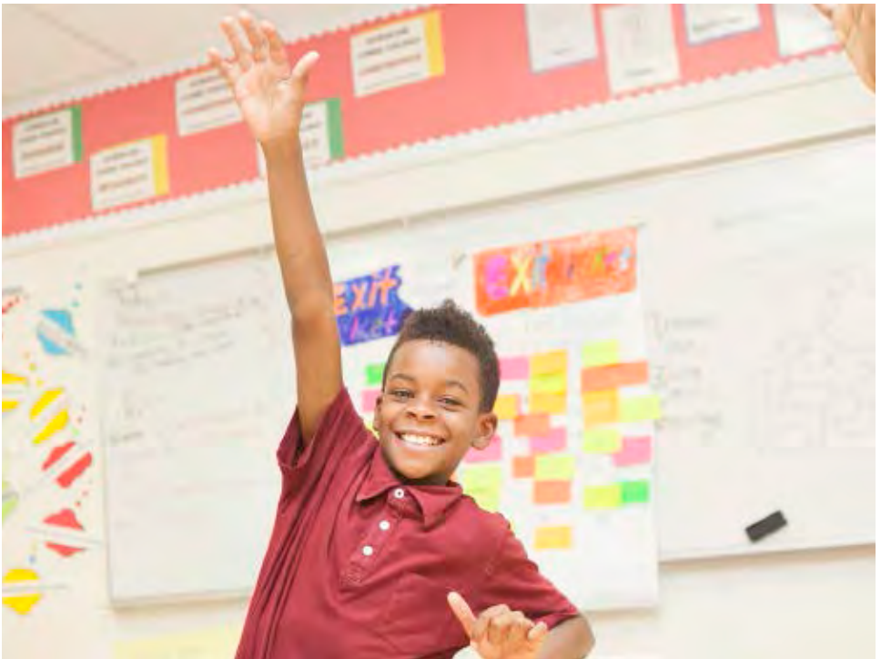
Trường Bán công Friendship - Technology Preparatory Middle School Academy